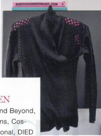
Wollen truitje van Marithé + François Girbaud, gekocht van mijn eerste salaris