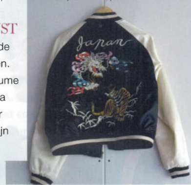
Baseballjack uit Japan