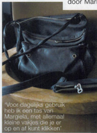
'Voor dagelijks gebruik heb ik een tas van Margiela, met allemaal kleine vakjes die je er op en af kunt klikken'